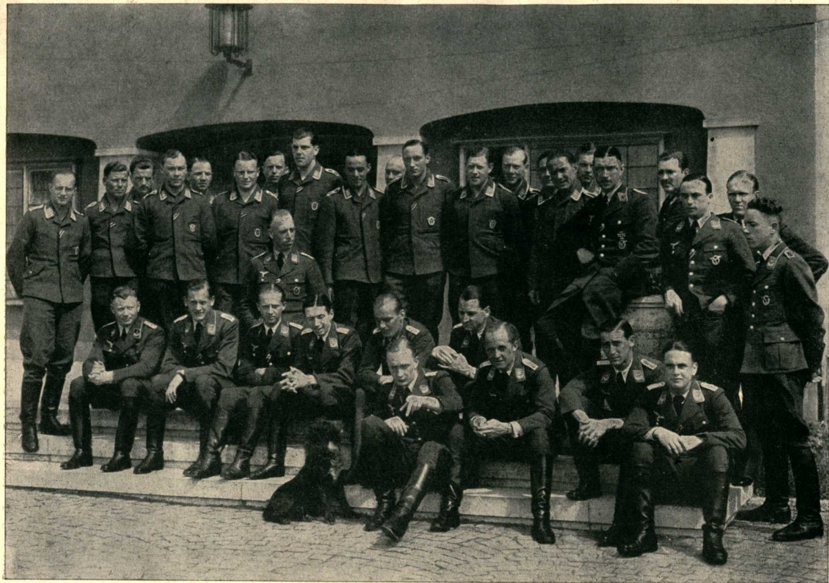
Die Flugzeugführer der III. Gruppe, wenige Tage vor dem 10. Mai 1940