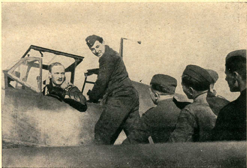
Oberleutnant Claus nach seinem 14. Luftzieg.