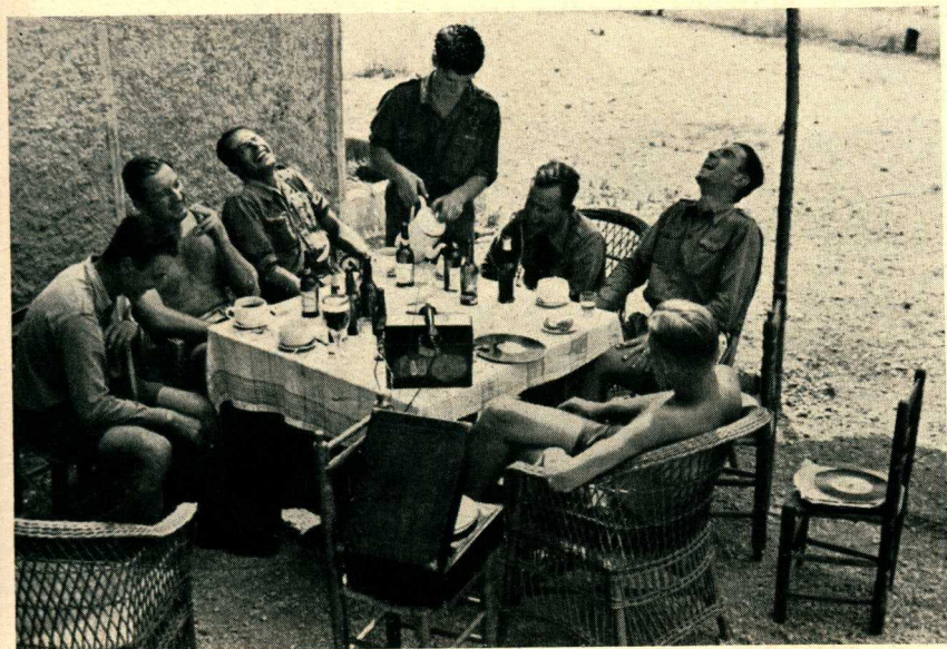
Der Witz muß gut gewesen sein