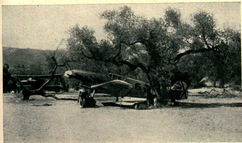
Me 109 unter Oliven