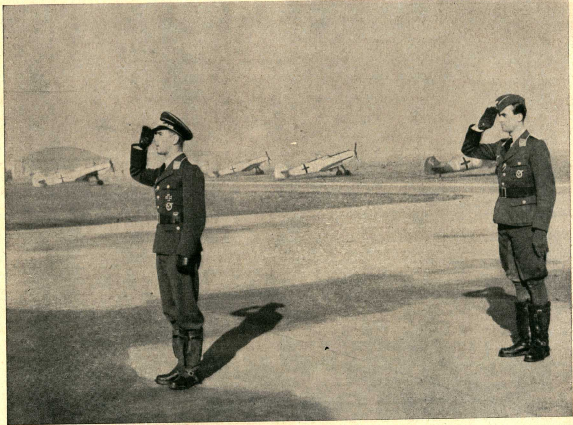
Hauptmann Mölders mit Adjutant Leutnant Radlich.