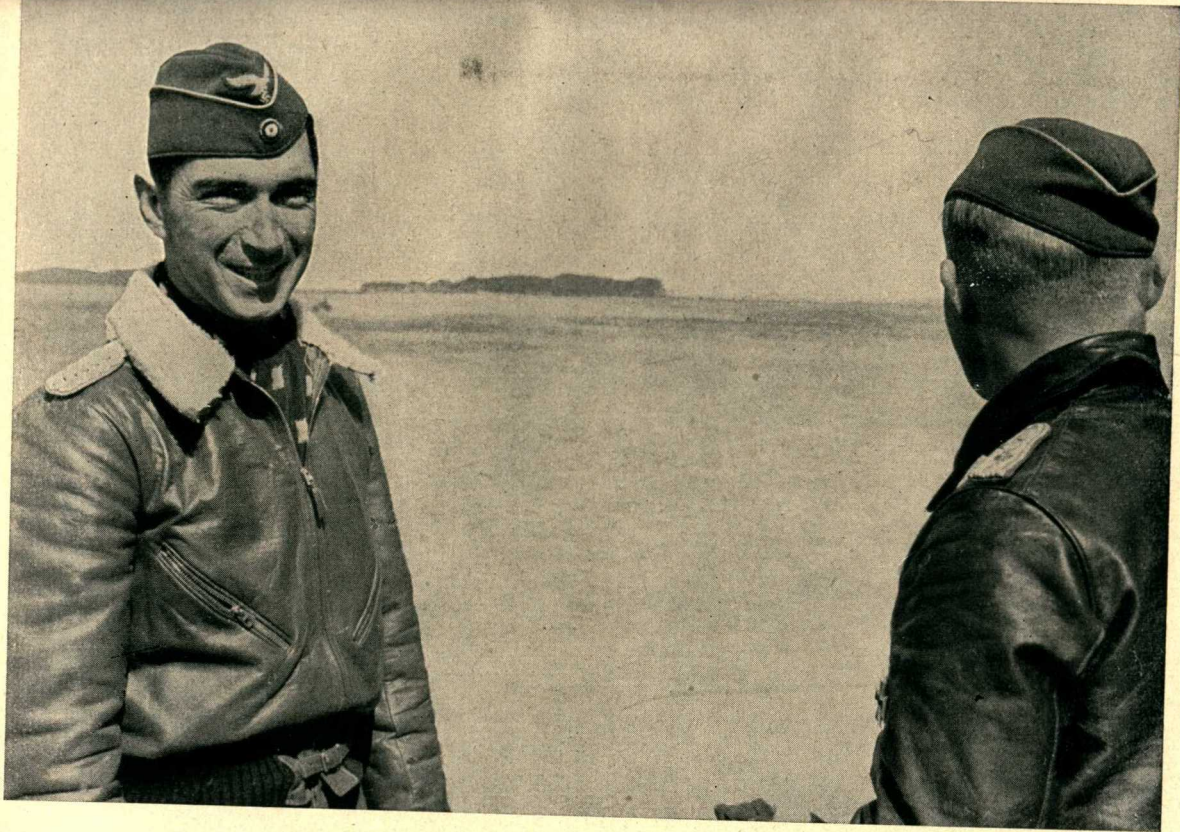
„Das war heute ein erfolgreicher Tag.“ 31. August 1940. 24 Luftsiege — kein Verlust.