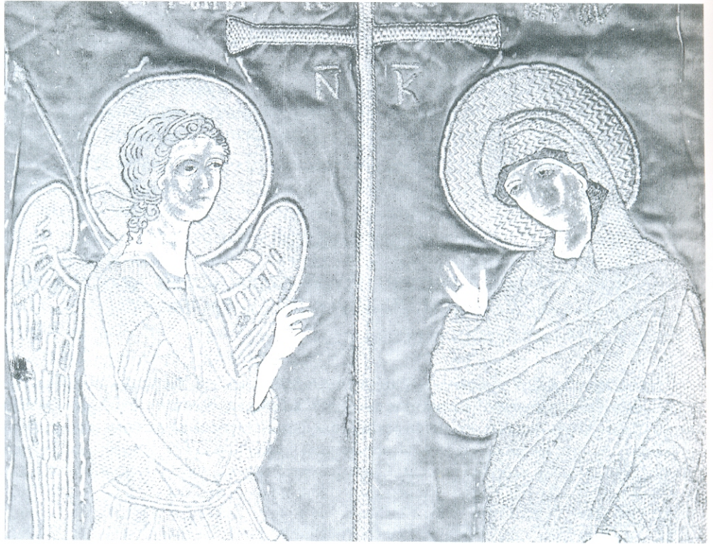
Централна сцена са катапетазме монахиње Агније, детаљ