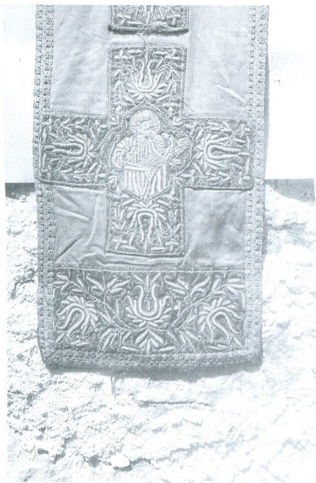
Други епитрахилъ из манастира Пиве, деталъ