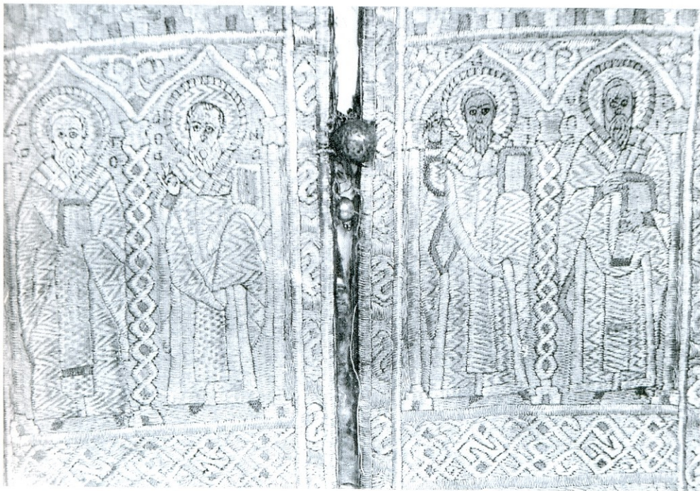
Епитрахиль из монастыря Крке, деталь