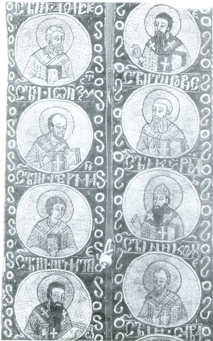
Епитрахиль из монастыря Студенице, деталь