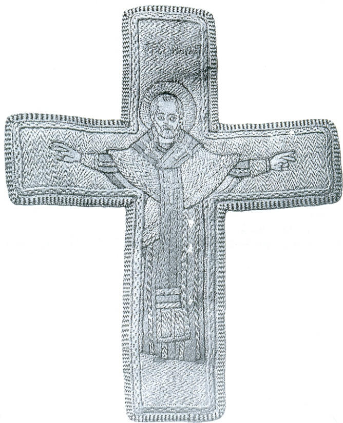
Омофор из монастыря Пиве, деталь