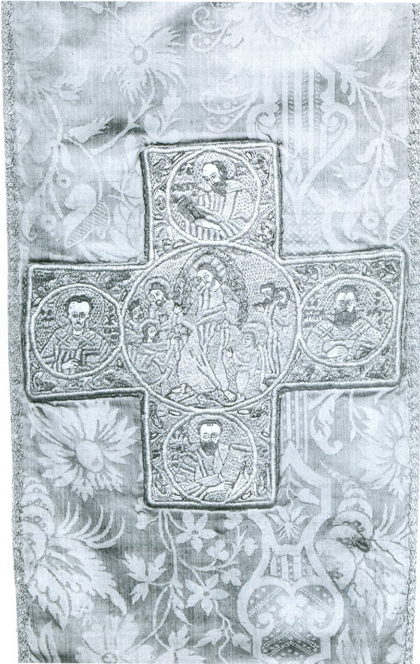
Крст са омофора са представом Силаска у ад, Музеј Српске православне цркве, Београд