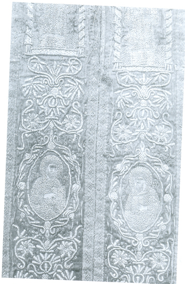
Епитрахиль из монастыра Пиве, исти детал