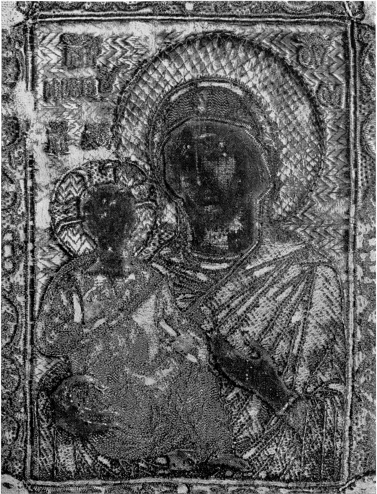
ВЕЗЕНА ИКОНА, XIV ВЕК (Музеј примењених уметности у Београду)