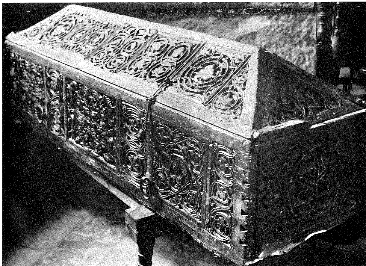
САРКОФАГ СТЕФАНА ДЕЧАНСКОГ, XIV ВЕК (Ризница манастира Дечана)