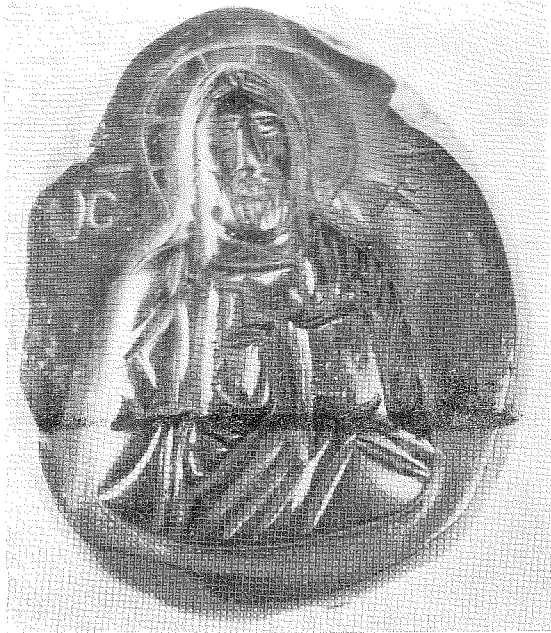
КАМЕЈА ИЗ XIII ВЕКА (Музеј примењених уметности у Београду)