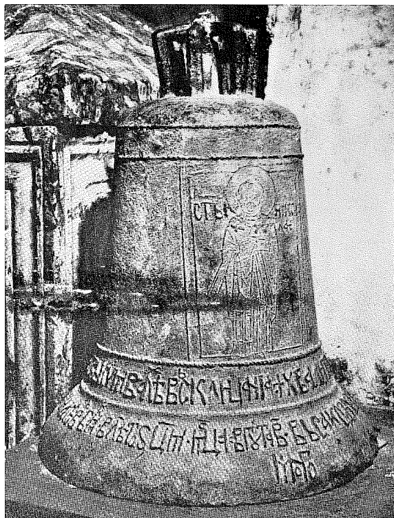
РОДОПОВО ЗВОНО, ИЗ 1432 ГОДИНЕ (Ризница Пећке Патријаршије)