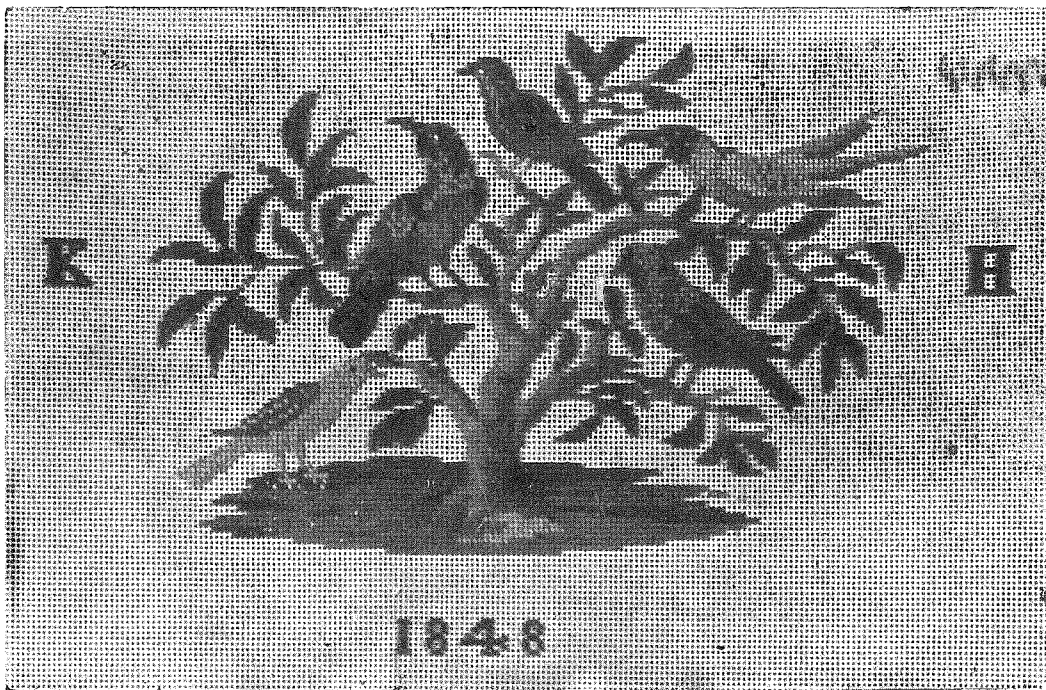
Сл. 2. Вез перлама из Крагујевца, 1848. Музеј примењене уметности, Београд.

Ова техника рада и материјал карактеристични су и јако омиљени у првој половини XIX века. У ово време често се срећу, чаше, боце, штапови и други предмети обавијени везом рађеним перлама.