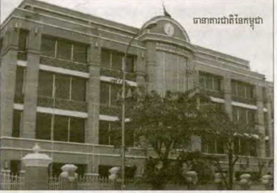
ធនាគារជាតិនៃកម្ពុជា

បញ្ហាកិច្ចសហប្រតិបត្តិការវិសមភាព ភាពត្រីក្រ ទនយោបាយមិនពិតប្រាកដ ហើយនិងអសន្តិសុខជា ហេតុផលមិនបានបញ្ឈប់ការចរាចរនៃដុល្លារទៅ បាន ទោះជាយ៉ាងនេះក្តី មានមធ្យោបាយមួយចំនួន ដែលរដ្ឋាភិបាលអាចជួយដល់ដំណើរការនេះ ។ យោង តាមការបញ្ជាក់របស់សាស្ត្រាចារ្យនៃវិទ្យាស្ថានអភិ វឌ្ឍន៍ស្រាវជ្រាវ ឥណ្ឌូហ្គាន់ឌី រដ្ឋាភិបាលអាច ប្រព្រឹត្តនិងនិយមន័យឱ្យត្រូវប្រកួតប្រជែងនៃប្រទេសដាក់ លាក់មួយចំនួន ត្រូវតែធ្វើជារូបិយប័ណ្ណក្នុងស្រុក