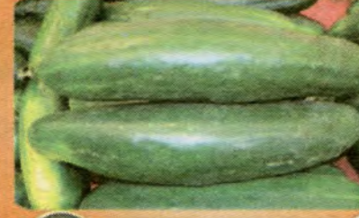
$0.49 per LB