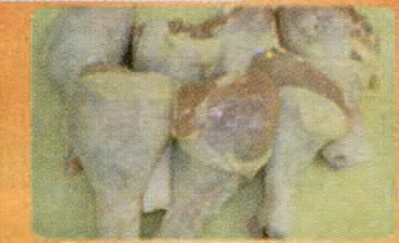
$ 0.69 per LB