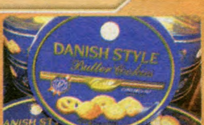
$ 3.99 per Tin