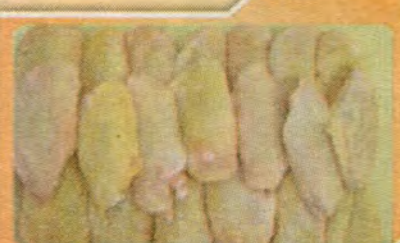
$1.99 per LB