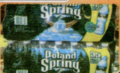
$10 for 2cases