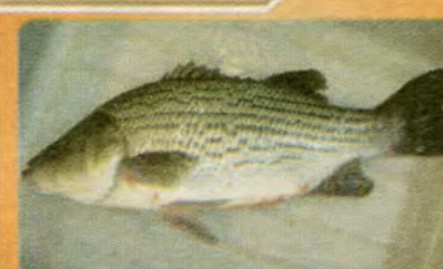
$5.99 per LB