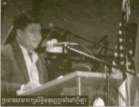
ប្រធានសហគណបក្សសិទ្ធិមនុស្សប្រចាំទ្វីបអាស៊ី