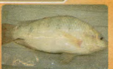
$3.69 per LB