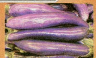
$0.79 per LB