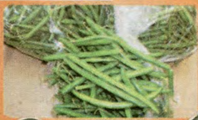
$0.69 per LB