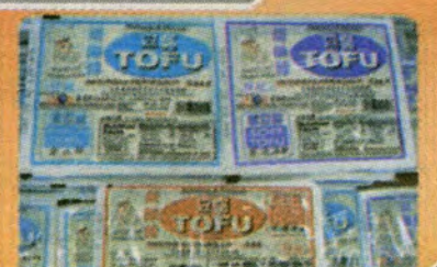
$0.99 per Box