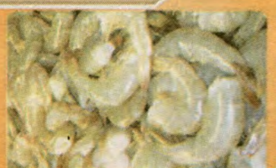
$10 per 2LB