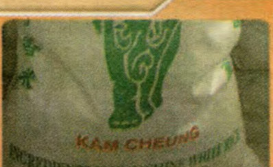
$16.99 per Bag