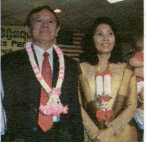
ផ្សេងៗជាច្រើនក្នុងសហគមន៍ ហ្វីឡាដែលហ្វៀ ដូចជា សមាគមខ្មែរ, សមាគមព្រឹទ្ធាចារ្យខ្មែរ-អាមេរិកាំង, ក្រុមអតីតយុទ្ធជន, សហព័ន្ធខ្មែរក្រោម, ក្រុម ពាណិជ្ជករក្នុងតំបន់ (តទៅទំព័រទី១៤)

ដោយ : អ៊ឹម លឿម ក្រុមអ្នកគាំទ្រគណបក្សសិទ្ធិមនុស្ស ព្រមទាំង ភ្ញៀវជាតិ និងអន្តរជាតិជាង ៣០០នាក់ ត្រូវបានមក ជួបជុំគ្នានៅភោជនីយដ្ឋាន HAI TIEN ស្ថិតនៅ លើផងវិថី WASHINGTON AVE នាតំបន់ហ្វីឡា - ដែលហ្វៀខាងត្បូង នាភ្នំថ្ងៃសៅរ៍ ទី២៨ ខែសីហា កន្លងមកនេះ ។ ដើម្បីជួយរួមប្រារព្ធខួបឆ្នាំទី៣ នៃ ការចាប់បដិសន្ធិគណបក្សដក្រុងខ្មែរនេះ ក្រោម អធិបតីនៃប្រធានបក្ស គឹម សុខា និងភរិយា ព្រម ទាំងបុត្រី ។ ឥស្សរជនសំខាន់ៗរបស់បក្សត្រូវបានគេ រាយការណ៍មកថា បានធ្វើដំណើរមកពីបណ្តា រដ្ឋជាង ១០របស់សហរដ្ឋអាមេរិក. កាណាដា, និងបារាំង ដោយក្នុងនោះគេក៏សង្កេតឃើញមានវត្តមានរបស់ក្រុម