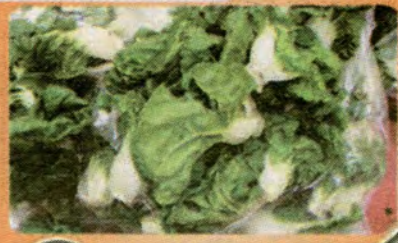
$0.59 per LB.