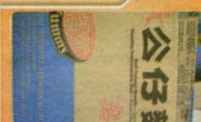
$ 7.99 per Box

571 ADAMS AVE. PHILADELPHIA, PA 19120 Tel : 215-728-1300 Fax : 215-728-1600