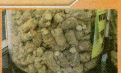
$49.99 per LB