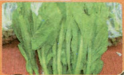
$0.79 per LB.