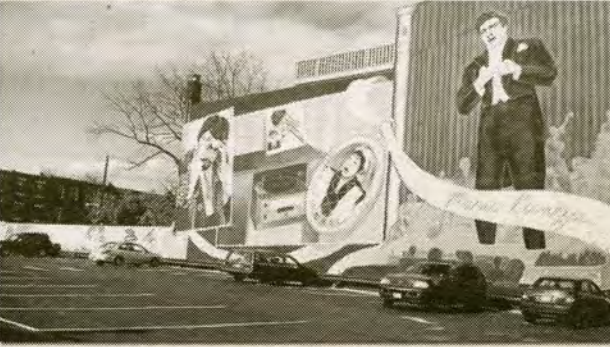
(Locates in South Philly, convenience traffic, and free parking)

Traditional Funeral Baldi Funeral Home provides caskets, cemetery space, floral arrangements, and funeral service options in various price ranges. Cultural and Religious funeral service is honored. We put full efforts to meet your needs and fulfill your wishes.