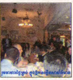
មេធាវី ហានវ៉ែន លីម (Press Club)