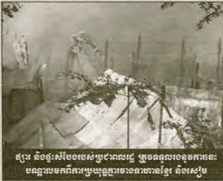
ខ្មែរ និងថៃសម្រេចសម្រេចស្របគ្នា ក្នុងការស្រាវជ្រាវ មណ្ឌលស្រាវជ្រាវ មណ្ឌលស្រាវជ្រាវ មណ្ឌលស្រាវជ្រាវ

ការប្រយុទ្ធគ្នានេះ បណ្តាលឱ្យមានការបាត់ បង់ជីវិត និងរបួសទាហានមួយចំនួនទាំងសងខាង ដែលអាជ្ញាធរយោធានៃប្រទេសទាំងពីរ កំពុង ចោទប្រកាន់គ្នាទៅវិញទៅមក ដោយពុំព្រម ទទួលកំហុសថា ជាអ្នកបង្ករឿងមុនដំបូងនៃការ ប្រយុទ្ធគ្នាយ៉ាងសាហាវនោះឡើយ ។