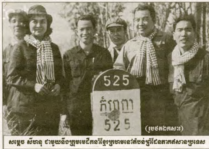
សម្តេច សីហនុ ជាមួយនិងក្រុមមេដឹកនាំខ្មែរក្រហមនៅតំបន់ព្រៃជនភាពសាមគ្គីសង្គម

ណាម្នាក់សារភាព ឬទទួលខុសត្រូវក្រៅតែពី ការអួតអាងថា ខ្លួនដឹកនាំ និងធ្វើអ្វីៗសុទ្ធតែ