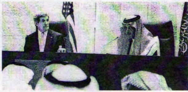
តាំងជាយូរមកហើយអំពីកម្មវិធីស្រាវជ្រាវបរមាណូរបស់រដ្ឋអ៊ីស្លាម នេះដែលបដិសេធសកម្មភាពណាមួយបែបនេះ ។

ព្រះអង្គម្ចាស់ សាអូដ បានមានព្រះបន្ទូលថា ប្រទេសអារ៉ាប៊ីសាអូឌីត "គាំទ្រកិច្ចប្រឹងប្រែងដោះស្រាយវិបត្តិតាមផ្លូវការទូត