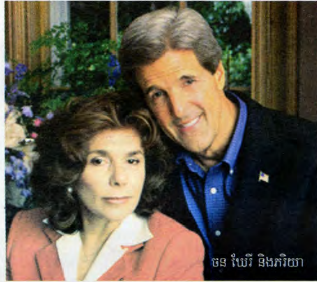
ចន ឃើរ និងភរិយា

ដើម្បីជម្រះរាល់មន្ទិលជុំវិញកម្មវិធីនុយក្លេអ៊ែររបស់ ប្រទេស អ៊ីរ៉ង់" ។ ព្រះអង្គម្ចាស់មានបន្ទូលបន្ថែមថា "ម៉្លោះហើយហើយសង្ឃឹម ថា ការចរចានឹងបានជាលទ្ធផលដោយការបញ្ចប់បញ្ហានេះជាជាង គ្រាន់តែរាំងខ្ទប់ស្ថានការណ៍" ហើយក៏ត្រូវពិចារណាផងដែរថា ទ្រនិចនាឱ្យកាចេះតែដើរទៅហើយ ហើយការចរចាមិនអាចបន្ត រហូតនោះទេ" ។