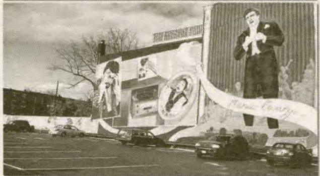
(Locates in South Philly, convenience traffic, and free parking)

ឈ្មោះណាមួយក៏ត្រូវប្រព្រឹត្ត ឈ្មោះណាមួយក៏ត្រូវប្រព្រឹត្ត មានផ្តល់ជូននូវការមឈូស ទីប្តូរ សំរាប់បញ្ចុះ រៀបរយរងផ្កា និងសេវាឈ្មោះណាមួយ ច្រើនប្រភេទ តម្លៃទៅតាមប្រភេទដែលត្រូវការ សេវាឈ្មោះណាមួយវប្បធម៌ និងតាមសាសនា និងបំពេញជូនជាកិត្តិយស យើងនឹងខំឱ្យអស់ពី សមត្ថភាព ដើម្បីបំពេញសេចក្តីត្រូវការ និង បំពេញប្រាថ្នារបស់លោកអ្នក ។