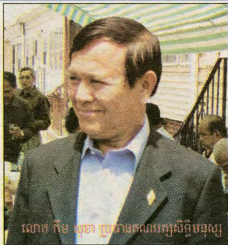
លោក កឹម សុខា ប្រធានគណបក្សសិទ្ធិមនុស្ស

◆◆◆ នៅទីស្នាក់ការសាខាគណបក្សសិទ្ធិមនុស្ស នៅហ្វីឡាដេលហ្វី មានការជួបប្រជុំគ្នា នាថ្ងៃទី៧ ខែ មិថុនា ដើម្បីទទួលសមាជិកសភាខ្មែរពីររូប គឺលោក កឹម សុខា និងលោក យែម បុណ្ណារិទ្ធ ដែលជាប្រធាន និងអគ្គលេខាគណបក្សដដែល ។