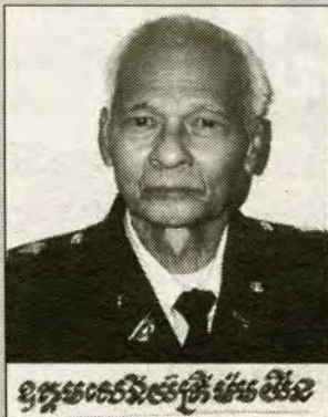
ឧត្តមលោកយោធិ៍ ម៉ាម យីន

...អតីតយុទ្ធជនខ្មែរ ទើបនឹងបានទទួលស្គាល់នូវតុណ្ហាចំណាត់ក្នុងរយៈពេលដែលខ្លួនបានបំរើក្នុងកងទ័ព តើអ្នកទាំងនោះ បានធ្វើអ្វីខ្លះសម្រាប់ប្រវត្តិសាស្ត្រនៅកម្ពុជា ឬក៏ បានស្តាប់យុទ្ធជនម្នាក់ម្តងៗ ហើយរាយការណ៍ជូនសណ្ឋាគៈ :