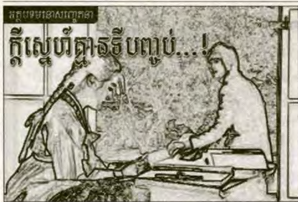
ដោយ : គឹម កៀន (ពិពណ៌នា)

... ក៏ត្រូវអរគុណអ្វីមួយប្រៀបបាន ធ្វើឱ្យនាងហាក់ដូចជាដឹងដឹងដឹងដឹង តែច្បាប់ចម្លងបង្កប់ ខ្លួនវិញ។ ដៃដឹងញើច់ប្រប់ នាងប្រាស់គេទៅលើត្រពូក ដែលមាន កម្រាលសក្ការៈ មានខ្នើយមួយគូ មានស្រោមប៉ាក់សត្វចាប់មួយគូខ្លាំង មែកប្រាប្រមូលទម្ងន់ស្លាប់ហើរទៅតាមគ្នា វាទៅក្នុងបរិយាកាសមួយដំ សែនវិកាយ ។ ទឹកភ្នែកនាងហូរចុះមកលើផ្ទាំងទាំងពីរ ដោយពុំដឹងខ្លួន ថា បានហូរពីកាលណាមក... សំបុត្រដាក់លើទ្រូងមិនទាន់ដាច់ចិត្តហ៊ាន បើកមើល ព្រោះមិនដឹងមានរឿងល្អ ឬអាក្រក់យ៉ាងណាម្តេចក៏បាត់ ដំណឹងយូរម្ល៉ឹងៗ។ នាងចេះតែគិតចេះតែស្រមៃម្តង រឿងល្អម្តងរឿង អាក្រក់។ ចុងក្រោយនាងបើកយកសំបុត្រមកអានដោយផ្អិតផ្អង់ ទឹក មុខនាងក៏ម្តងប្រែជាញញឹមម្តងជាស្រពោលទៅតាមដំណើររឿងដែលរិះ របស់នាងសរសេរវាយវាប្រាប់នាងពីដំណើរជីវិតជាអ្នកលើកឡើង លក់ ជីវិត ដើម្បីសងបំណុលជូនជាតិខេមរា។ នាងបានចូរចិត្តខ្លាំងណាស់ដោយ ដឹងថា គេមានជីវិតរស់នៅទៅទៀត តែនាងក្នុងក្រុមខ្លាំងណាស់ពេល សង្គ្រាមស្រមៃថា ខ្លួនគេបានស្លាប់ ហើយមានរទេះសេះមួយអូស