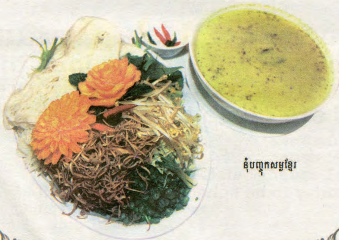
តុំបញ្ចកសម្បខ្មែរ

320 OREGON AVENUE . PHILADELPHIA PA 19148 . 215-952-6688