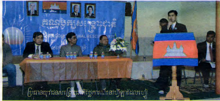
ប្រធានយុវជនសង្គ្រោះជាតិថ្មីការណ៍នៅហ្សឺណែវដែលហ្សឺ