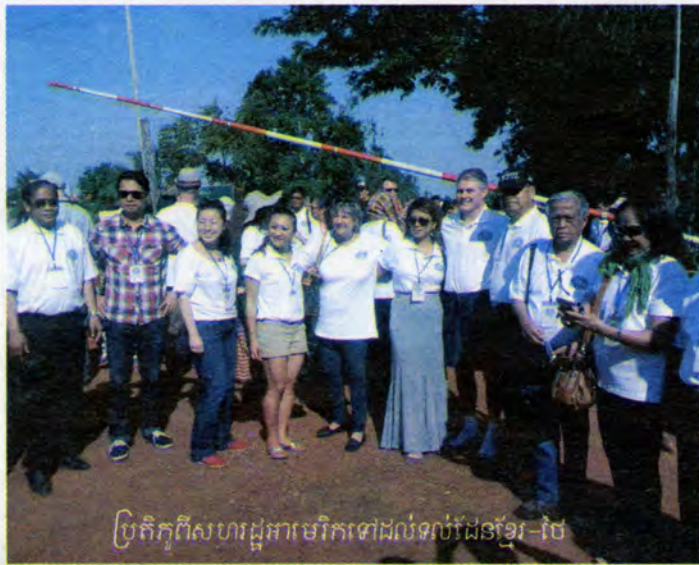
ប្រតិភូពីសហរដ្ឋអាមេរិកទៅដល់ទំព័រដើមខ្មែរ-ថៃ