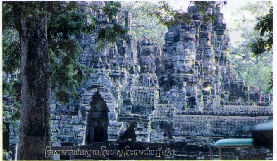
ប្រាសាទបាយ័នស្ថាមព្រះហស្តព្រះបាទជ័យវរ្ម័នទី២

ទឹកអម្រិតដែលនឹងផ្តល់ជីវិតអមតៈដល់អ្នកដែលបានឈ្នះយកទឹកអម្រិតនោះមកផឹកបានមុនគេ ។ ចូលទៅដល់ក្នុងបរិវេណតាមក្លោងទ្វារមុខព្រហ្មដ៏