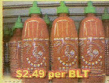
$2.49 per BLT