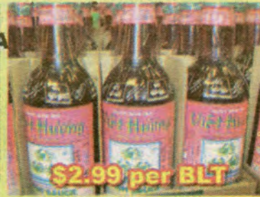
$2.99 per BLT