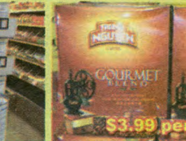
$3.99 per Box