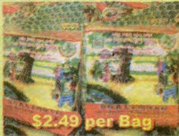
$2.49 per Bag