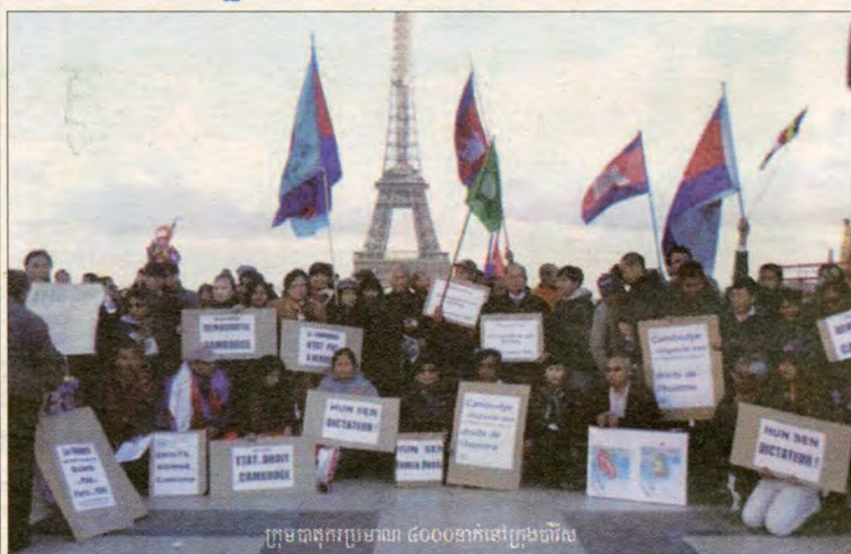
ក្រុមបុគ្គលិកប្រមាណ ៤០០០នាក់នៅក្រុងប៉ារីស

លេចពីប្រកាសរបស់លេខាធិការក្រៅប្រទេស មហាបាតុកម្មទូទាំងពិភពលោក ដើម្បីការពារបូណ៌ភាពទឹកដី ទិវាសន្តិសុខក្រុងប៉ារីស ថ្ងៃទី២៣ ខែតុលា ឆ្នាំ១៩៩១ ក្រុងប៉ារីស ២៤ ខែតុលា ឆ្នាំ២០១០. ព្យួរយ៉ក ២២ ខែតុលា ឆ្នាំ២០១០. អ៊ីតាលី ២២ ខែតុលា ឆ្នាំ២០១០ ទីក្រុងសាន់ហ្វ្រានស៊ីស្កូ ២២ តុលា ២០១០។ ដោយយល់ឃើញថា ប្រទេសកម្ពុជា យើងបានទទួលរងការបាត់បង់ទឹកដី និងបន្តរំកិលព្រំដែន