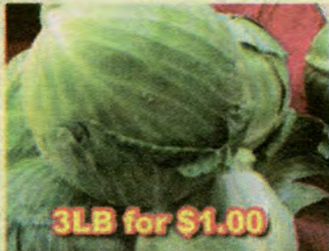
3LB for $1.00