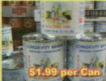
$1.99 per Can