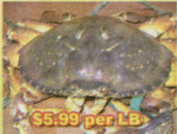
$5.99 per LB