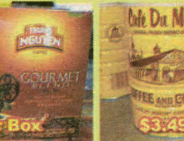
$3.49 per Can