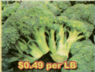
$0.49 per LB