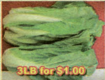
3LB for $1.00