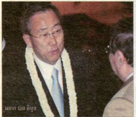
លោក ហ៊ុន សែន

ខ្មែរខ្មែរ : លោក ហ៊ុន សែន អគ្គលេខាធិការថ្មីរបស់ អ.ស.ប បានធ្វើទស្សនកិច្ចនៅកម្ពុជាពីថ្ងៃទី២៦ ខែតុលាមុននេះ។ លោកបានទៅទស្សនាជាអាទិ៍នៅមន្ទីរពេទ្យរុស្ស៊ីផ្នែកសសៃប្រសាទ. ទស្សនាសាលាកិត្តិយាការអន្តរជាតិ ហើយបានជួបពិភាក្សាជាមួយលោកនាយករដ្ឋមន្ត្រីខ្មែរ ហ៊ុន សែន មុននឹងបន្តដំណើរទៅកាន់វៀតណាម។