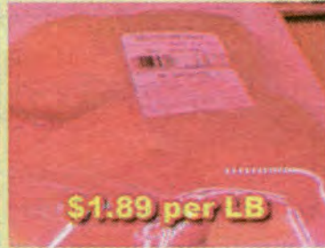
$1.89 per LB