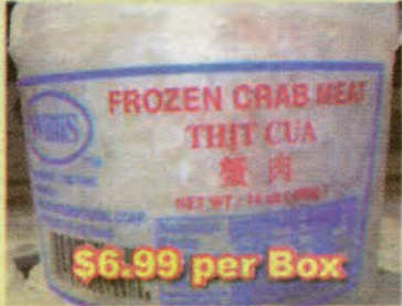
$6.99 per Box