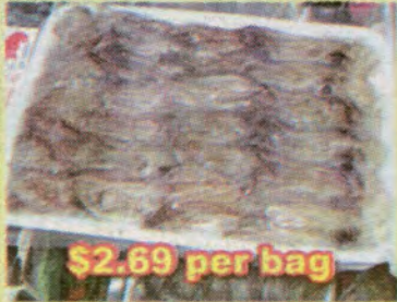
$2.69 per bag