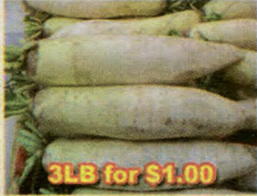
3LB for $1.00