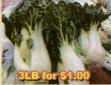
3LB for $1.00