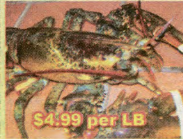
$4.99 per LB