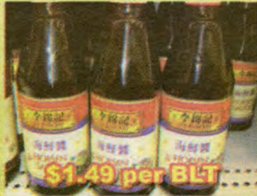
$1.49 per BLT