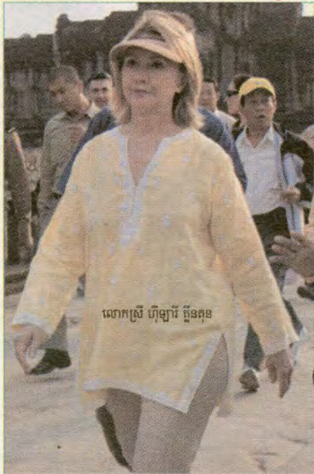
លោកស្រី ហ៊ុន ធីន

ខ្មែរខ្មែរ : ទស្សនកិច្ចដ៏គួរឱ្យកត់សំគាល់ម្នាក់ទៀតនោះ គឺលោកស្រី ហ៊ុន ធីន រដ្ឋលេខាធិការនៃរដ្ឋាភិបាល អូស្ត្រាលី ក៏បានទៅទស្សនកិច្ចនៅកម្ពុជាដែរ ថ្ងៃទី៣០ ខែតុលានេះ។ លោកស្រីបានទៅធ្វើទស្សនកិច្ចនៅអង្គរវត្ត នៃខេត្តសៀមរាប ហើយបានជួបប្រជុំយោងទាក់ទងនឹងមន្ត្រីជាន់ខ្ពស់នៃរដ្ឋាភិបាលខ្មែរ ហើយនិងចូលគោលព្រះមហាក្សត្រ នរោត្តម សីហមុនី ផងដែរ។