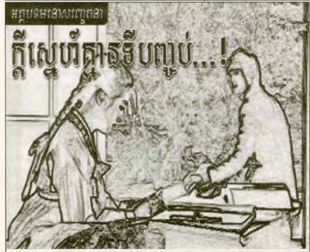
ដោយ : តឹម កៀន (តពីលេខមុន)

ប្តីលិសខេត្តបាននិយាយកាលពីថ្ងៃម្សិលមិញថា កាលពី ថ្ងៃពុធបុរសអាយុ៣០ឆ្នាំម្នាក់ នៅខេត្តក្រចេះបានកាប់ប្រពន្ធ របស់ខ្លួនរហូតដល់ស្លាប់ដោយកាំបិតផ្តាច់មួយមុនពេលចាក់ ទ្រូងខ្លួនឯងដោយកាំបិតចិតបន្តិចមួយ ហើយនៅពេល ដែលខ្លួនមិនទាន់ស្លាប់ភ្លាម គាត់បានចងកសម្លាប់ខ្លួន ។ លោក យិន ច័ន្ទហាំង នាយរងប៉ូស៊ីបានថ្លែងថា ឈ្មោះ តុក លើស តាមចោទថា បានកាប់ឈ្មោះ ជូរ ជា អាយុ៣៥ឆ្នាំ ស្នាក់នៅ ក្នុងឃុំព្រែកប្រសប់ ស្រុកព្រែកប្រសប់ បន្ទាប់ពីអ្នកស្រីបាន បដិសេធមិនព្រមជួបជុំជាមួយខ្លួនវិញ បន្ទាប់ពីចែកផ្ទះគ្នាថ្មី ទន្ទេរ ។ លោកស្រី មីម ណារិន អ្នកសម្របសម្រួលរបស់អង្គការ សិទ្ធិមនុស្សអាដហុកក្នុងស្រុកនៅខេត្តនេះ បានថ្លែងថា ឪពុក របស់ជនរងគ្រោះបាននិយាយថា អាពាហ៍ពិពាហ៍របស់គូរស្វាមី ភរិយាទាំង២នេះបានបែកបាក់ ពីព្រោះលោក លើស បានប្រើ អំពើហិង្សាជាច្រើនលើកទៅលើប្រពន្ធ ។ លោកស្រី ណារិន បានថ្លែងថា "អ្នកភូមិខ្លាចគាត់" ។ យោគកម្មថ្មីនេះ កើតឡើង បន្ទាប់ពីការកើតមានការវាយប្រហារអំពើហិង្សាក្នុងគ្រួសារ ដ៏ព្រៃផ្សៃដូចគ្នានេះ ។ កាលពីថ្ងៃអាទិត្យមុន មានមនុស្ស២ នាក់បានយកប្រេងសាំងចាក់ស្រោចលើប្រពន្ធរបស់ខ្លួន ហើយ ដុតពួកគេនៅក្នុងការវាយប្រហារ ដោយឡែកពីគ្នានៅក្នុង ខេត្តបន្ទាយមានជ័យ និងខេត្តកំពង់ចាម ។ ជនរងគ្រោះទាំង ២នាក់ បានស្លាប់ដោយសាររបួសរបស់ខ្លួន ។ ហើយនៅក្នុង ខេត្តសៀមរាបកាលពីថ្ងៃសៅរ៍មុនបុរសម្នាក់បានស្លាប់កូនស្រី អាយុ៦ឆ្នាំរបស់ខ្លួន និងធ្វើឱ្យប្រពន្ធរបស់ខ្លួនរងរបួសធ្ងន់ក្នុង ការវាយប្រហារដោយកាំបិតផ្តាច់មួយ ។