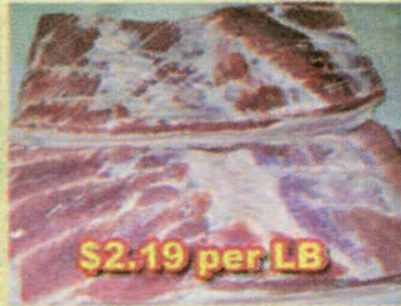
$2.19 per LB