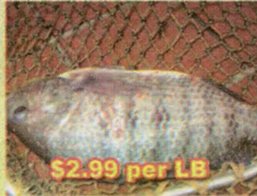
$2.99 per LB