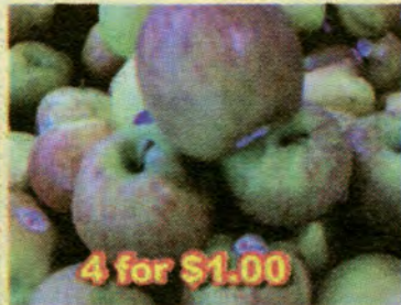
4 for $1.00