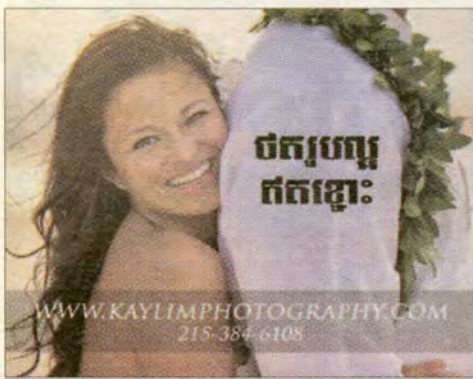
ចំរូបបញ្ចេញ ក្នុងឆ្នាំ៖