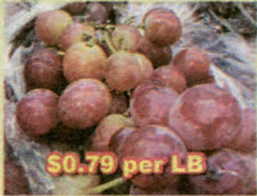
$0.79 per LB