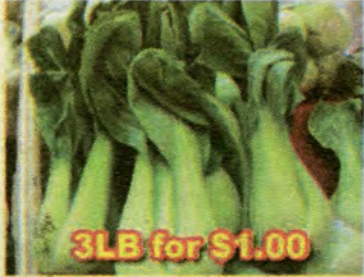
3LB for $1.00