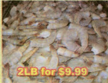
2LB for $9.99