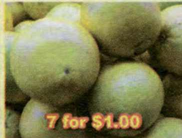
7 for $1.00