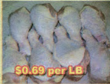
$0.69 per LB