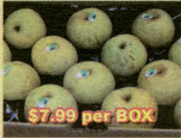
$7.99 per BOX