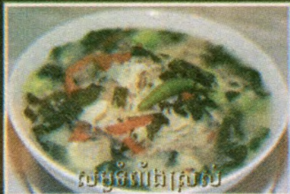
សម្លចំពងក្រូច