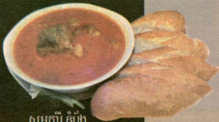
សម្លកាវី នំប៉័ង