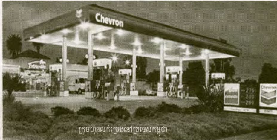
ក្រុមហ៊ុនស្រែងនៅប្រទេសកម្ពុជា

សម្បទានរុករករ៉ែនៅកម្ពុជាត្រូវបានធ្វើឡើងក្នុង ល្បឿនរហ័សពេកស្របពេលដែលខ្លះខាតនូវនីតិវិធី តម្លាភាព និងច្បាស់លាស់សម្រាប់ការបង់ប្រាក់ពី ក្រុមហ៊ុនដើម្បីទទួលបានសិទ្ធិរុករកធនធានប្រេង ឧស្ម័ន និងរ៉ែទាំងនោះ ។ យោងតាមច្បាប់ស្តីពីការ គ្រប់គ្រង និងធ្វើអាជីវកម្មលើធនធានរ៉ែ ក្រុមហ៊ុន ទាំងអស់តម្រូវឱ្យបង់ប្រាក់ចំណូលចូលថវិការដ្ឋសម្រាប់ ការចុះបញ្ជីការដាក់ពាក្យសម្រាប់ការព្យួរការបន្ត