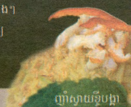
ញាំស្វាយខ្ចីបង្កា