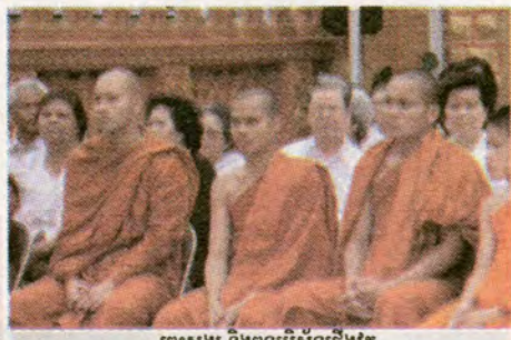
ព្រះសង្ឃ និងពុទ្ធបរិស័ទជើងវត្ត