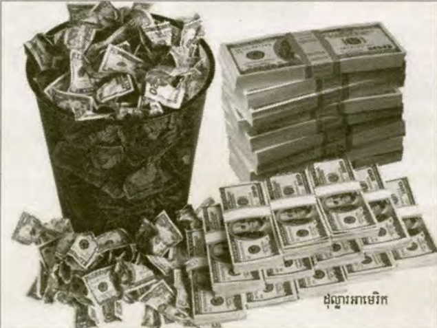
ដុល្លារអាមេរិក

ជាមួយគ្នានេះដែររូបិយប័ណ្ណក្នុងស្រុកប្រជាជនកម្ពុជា លាវ និងយួន ជាពិភពលោកប្រើប្រាស់រូបិយប័ណ្ណរបស់ប្រទេសផ្សេង ដើម្បីធ្វើសកម្មភាពពាណិជ្ជកម្ម ។