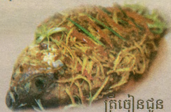
ត្រីចៀនជួន