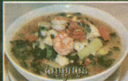
សម្លម្លូយួន