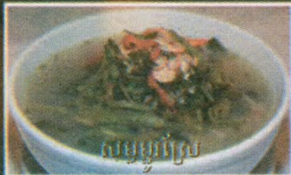
សម្លម្លូព័ទ្ធជុំ