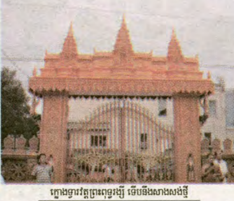
ក្លោងទ្វារវត្តព្រះពុទ្ធរង្សី ទើបនឹងសាងសង់ថ្មី

យោបល់ណាម អ៊ឹម លឿម ហិរ្យាដល់ហ្វៀ : ពិធីបុណ្យសម្តោងក្លោងទ្វារវត្តត្រូវបានប្រារព្ធធ្វើនៅថ្ងៃទី២១-២២ នាសប្តាហ៍កន្លងទៅនេះ ។ (តទៅទំព័រ ១១)