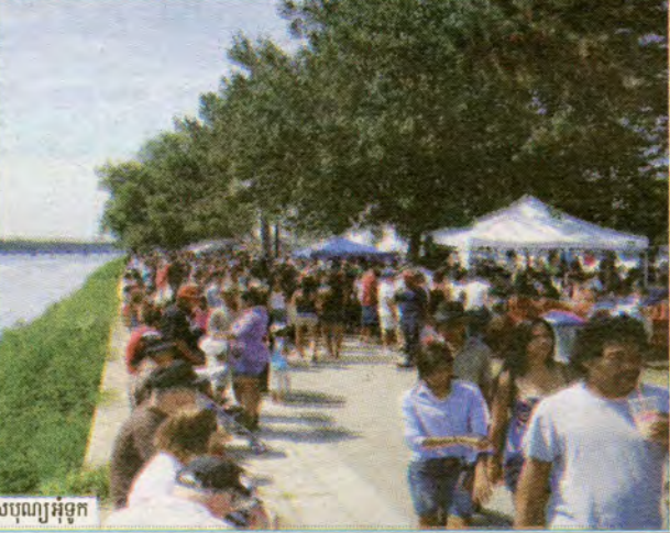
ដៃសមុទ្រ មេរ័ទាក់ នាឱកាសបុណ្យអុំទូក

ហើយដាច់ស្រាយយ៉ាងនេះ ។ គេអាចទិញស្បែកកៅដៃលក់ម្រមាន, ទិញថាសចម្រៀង ឬកុន, ទិញបង្ហាងតំនូរ, របស់តាំងលំអរផ្ទះតាមរបៀបអាស៊ី ទិញរហូតដល់បន្លែ ផ្លែឈើទៀតផង ។ ម្ហូបចំណីតាមទំនៀមទំលាប់បានត្រូវលក់ជាហូរហែរ ភោសដ្ឋៈ ឬទឹកក្រអូកដ៏ត្រជាក់ចិត្ត បានក្លាយជាទីចំណូលចិត្ត ដោយធាតុអាកាសថ្ងៃនេះ អំណោយផលដល់ពិធីបុណ្យនេះណាស់ ។