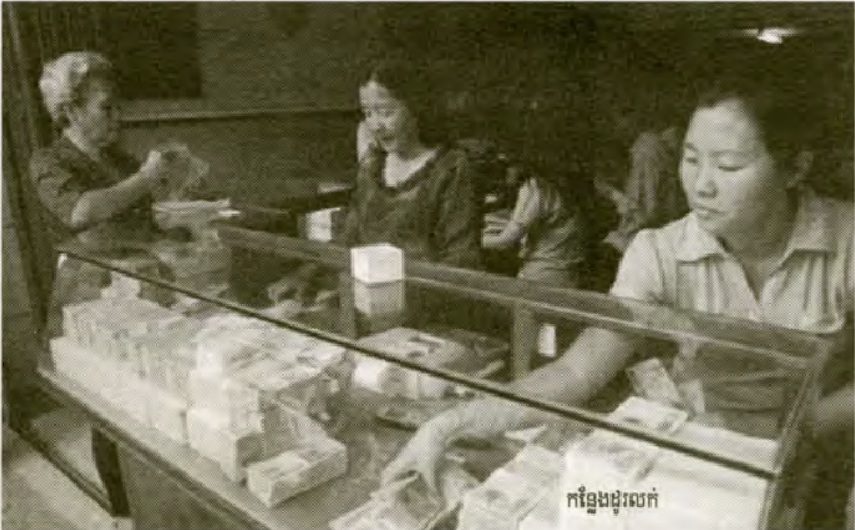
កន្លែងដុល្លារ

សៀវភៅរបស់ធនាគារអភិវឌ្ឍន៍អាស៊ីបានលើកអនុសាសន៍ថា កិច្ចសហប្រតិបត្តិការដ៏ជិតស្និទ្ធលើបញ្ហារូបិយវត្ថុ និងហិរញ្ញវត្ថុអាចនឹងជួយដល់ប្រទេសកម្ពុជា លាវ និងយួនដើម្បីដោះយ៉ាងមានប្រសិទ្ធភាពចំពោះការប្រឈមមុខនានា ដែលកើតឡើងពីការប្រើប្រាស់ពហុរូបិយប័ណ្ណនៅក្នុងវិស័យសេដ្ឋកិច្ចផ្សេងៗគ្នារបស់គេ ។