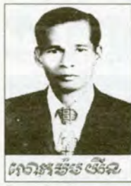
ដោយ : ម៉ម យ៉ន (តំណែងមុន)

ថ្នាក់ជាន់ខ្ពស់ដឹកនាំទៅបាននាំគ្នាធ្វើដំណើរចេញទៅយ៉ាងសង្ហារម្មណ៍អាចក្លាហានទៅតាមច្រកផ្លូវចូលដែលក្រុមកងសម្លាត់បានចូលទៅរៀបចំទុកឱ្យជាមុនស្រេចហើយនោះ ដោយគ្មានភ័យព្រួយពីការវាយប្រហារតបតពីកងទ័ពខ្មែរយួនឡើយ ។ ពីព្រោះមានសេចក្តីរាយការណ៍របស់បណ្តាញព័ត៌មានសម្លាត់ កងរដ្ឋបាល បានផ្តល់មកឱ្យយ៉ាងទៀតទាត់ហើយពិតប្រាកដផង ។