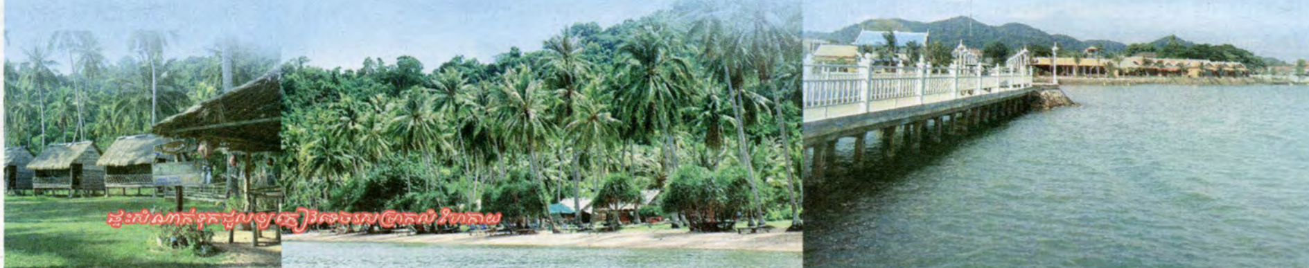
ផ្ទះលំហែកាយទុកដល់ភ្ញៀវទេសចរ @កោះទន្សាយ

ចំណែកផ្លូវដើរកម្សាន្តជុំវិញ កោះមានដើមរុក្ខជាតិស្រស់ត្រកាលផ្តល់ម្លប់ត្រឈឹងត្រឈៃល្អមនឹងត្រជាក់ស្រួលអារម្មណ៍បំពេរដោយសំឡេងបក្សាបក្សីដែលហ្លួងសត្វទាំងនេះវារមែងហិចហើរមកក្បែរៗច្រាំងនា វេលាថ្ងៃរៀបអស្តង្គតដើម្បីឃ្នាំចាប់ត្រីធ្វើជាចំណីទៀតផង ។ លើសពីនេះសហគមន៍ក៏មានបម្រើនូវសេវាម្ហូបអាហារតាមភោជនីយដ្ឋានផ្ទះសំណាក់ជាលក្ខណៈបឹងហ្លាឡូសម្រាប់ ទុកជូនភ្ញៀវទេសចរក្នុងតម្លៃសមរម្យ និងមានទុកចម្លងភ្ញៀវពីដែនម្ខាងទៅកាន់ទីកោះដោយទូក១គ្រឿងជួលក្នុងតម្លៃ២០ដុល្លារ ។ ចំពោះការធ្វើដំណើរត្រូវចំណាយពេលប្រមាណជា៣៥នាទី (ពេលស្ងប់រលក) ឬ៤៥នាទី ទៅ១ម៉ោង (រលកធំ) ដែលបច្ចុប្បន្ន យើងសង្កេតឃើញថាលំហូរចូលនៃភ្ញៀវទេសចរក្នុងស្រុកមានកំណើនគួរឱ្យកត់សម្គាល់ផ្ទុយពីពេលមុនគឺមានតែភ្ញៀវ