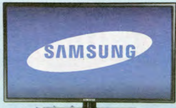
2nd PRIZE Samsung 32" LCD HDTV