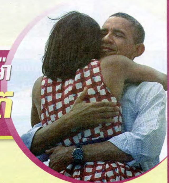
ចេញទៅបោះឆ្នោតបានច្រើន -ជនស្បែកខ្មៅ យុវជននិងស្ត្រីកេរ ពេទៅទំរាំ ១៦

ប្រជាប្រិយវិញ លោក បារ៉ាក់ អូបាម៉ា បាន ៥០%ទល់នឹង៤៨% ។ ក្នុងឱកាសដ៏លំបាកពលរដ្ឋអាមេរិកាំងបានបញ្ចេញសម្លេងគាំទ្រឱ្យលោក បារ៉ាក់ អូបាម៉ា នៅបន្តអាណត្តិប្រធានាធិបតីជាមួយលោកដោ បាយដិន អនុប្រធានប្រធានាធិបតី ។ អ្នកវិភាគព្រឹត្តិការណ៍បោះឆ្នោតប្រធានាធិបតីនេះបានកត់សម្គាល់ថា ការស្តង់មតិមុនបោះឆ្នោត បាន