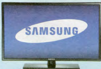
1st PRIZE Samsung 32" LED HDTV