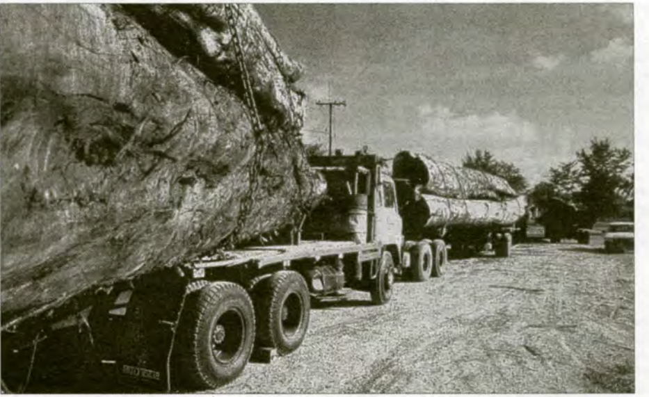
ម្នាក់កំណើតប្រមូលឈើ ២១ មីនា ឆ្នាំ ២០០៦

នៅក្នុងសិទ្ធិសិទ្ធិពិការភាពវិបាករាល់ប្រការ និងការបង្កាត់ប្រតិបត្តិការសម្បទានិកលើក ការចេញនូវលិខិតអនុញ្ញាត និងអាជ្ញាប័ណ្ណដំនើរ ដែលលិខិតអនុញ្ញាត និងអាជ្ញាប័ណ្ណដំនើរនេះ មានលក្ខណៈខុសច្បាប់ ឬត្រូវបានប្រើប្រាស់ឡើង ដើម្បីផ្តល់ការបិទបាំងដល់សកម្មភាពខុសច្បាប់ មានការកើនឡើង និងប្រភេទវិបាក។ ទាំងនេះ រួមមានលិខិតអនុញ្ញាតឱ្យប្រមូល "ឈើចាស់ៗ" - ដែលជាការអនុវត្តត្រូវបានហាមប្រាមដោយ ហ៊ុន សែន ក្នុងឆ្នាំ ១៩៩៩ ដោយសារតែការ