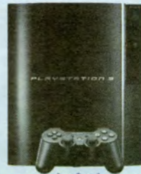
3rd PRIZE Sony Playstation 3

• ធ្វើថ្នាំជូនដល់ផ្ទះដោយឥតគិតថ្លៃ • ទទួលអ៊ិនស៊ុរស្ទើរគ្រប់មុខ • ទទួលបន្តផ្តល់ថ្នាំដែលលោកអ្នកកំពុងប្រើ ទិញមកពីឱសថស្ថានផ្សេងៗ • តម្លៃថោកៗបំផុត និងមានស្តុកឱសថគ្រប់មុខប្រភេទ • ផ្តល់សេវាដោយរហ័សទាន់ចិត្ត • មានឱសថវិទ្យាសាស្ត្រ-ឱសថវិទ្យាសាស្ត្រ និងឧបករណ៍ព្យាបាលមុខជំងឺ