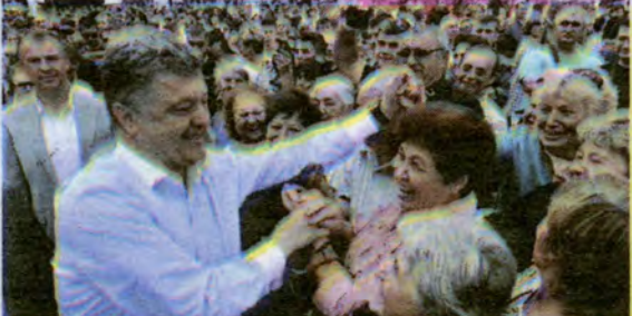
Chocolate tycoon heads for landslide victory in Ukraine presidential election. Presidential hopeful Petro Poroshenko meets supporters in Uman.

រុស្ស៊ីបានឈ្លានពានទឹកដីយូក្រែននាតំបន់ខាងត្បូង កាលពីខែ កុម្ភៈមក ។ តទៅទំព័រទី ១១