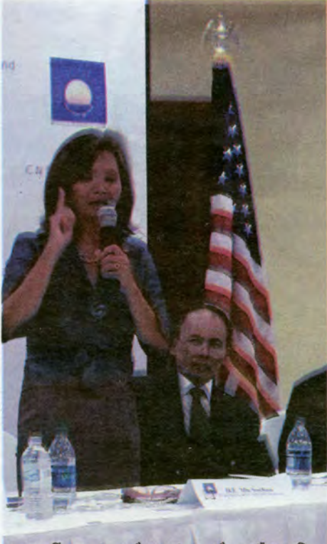
លោកស្រី មូរ សុខហួរ ថ្លែងទៅពលរដ្ឋខ្មែរនៅរដ្ឋអាមេរិក