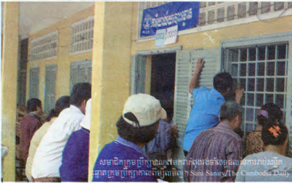
សមាជិកក្រុមប្រឹក្សាខណ្ឌព្រៃកក់ពង្រង់ចាំបេក្ខជននៃការបោះឆ្នោតក្រុមប្រឹក្សាកាលពីម្សិលមិញ។

នៅក្នុងការបោះឆ្នោតជ្រើសរើសក្រុមប្រឹក្សានេះកាលពីឆ្នាំ២០០៩គណបក្សប្រជាជនកម្ពុជា