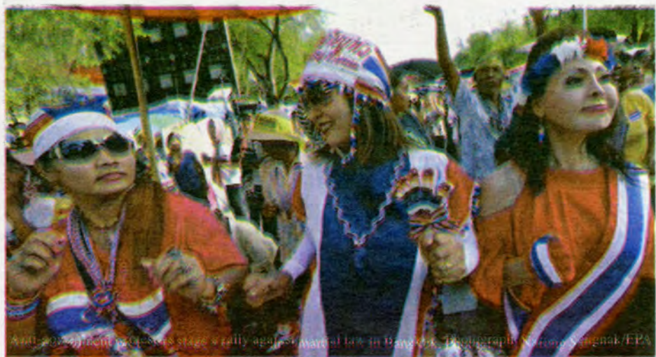
Anti-government protesters stage rally against martial law in Bangkok.

The statement - read out in one of a number of televised proclamations - said the military had been compelled to act because (Continued to Page 14)