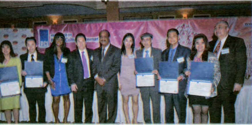
ហើយរំពឹងថា កម្មវិធីនេះនឹងក្លាយជាកម្មវិធី និងរបៀបវារៈនៃកម្មវិធីមានដូចខាងក្រោម ៖ មួយក្នុងសហរដ្ឋអាមេរិកក្នុងការផ្តល់ដល់នារី

អ្នកនាងសង្ឃឹមថា កម្មវិធីនេះនឹងមានភាព អាស៊ីអាមេរិកាំងនូវសម្លេងរឹងមាំក្នុងសង្គមអាមេរិក ច្រើន មានដៃគូស្ថាប័ន និងអង្គការជាតិ និង និងអន្តរជាតិ ។ ជាតិផ្នែកនេះបានសហការកាន់តែជិតជុំជាង កាលវិភាគកាលបរិច្ឆេទឈប់ទទួលពាក្យ