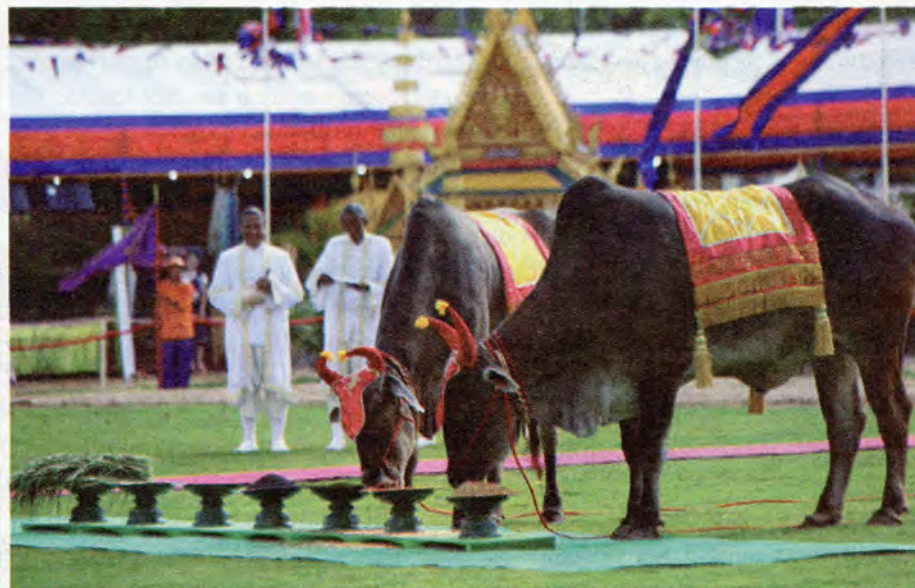
Two royal oxen eat from bowls during the annual Royal Plowing Ceremony in Takhmao City on Saturday. The animals ate beans, corn and rice, leading palace astrologers to predict a moderate crop yield. (Siv Channa)

Last year, one ox nibbled on corn while the other settled on grass from the Kompong Cham football pitch, where the