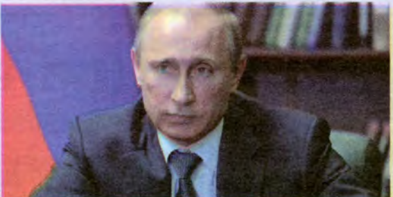
Vladimir Putin vows to respect Ukraine election result

សប្តាហ៍នេះនៅប្រទេសយូក្រែនកំពុងរៀបចំបោះឆ្នោត ជ្រើសរើសប្រធានាធិបតីថ្មីបន្ទាប់ពីបាតុករបានទម្លាក់ប្រធានា ធិបតីចាស់វិកទ័រ យានូកូវិក ដែលគាំទ្រស្រ្តីនិងចំពោះប្រទេស