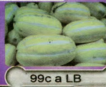
99c a LB