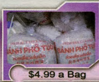
$4.99 a Bag