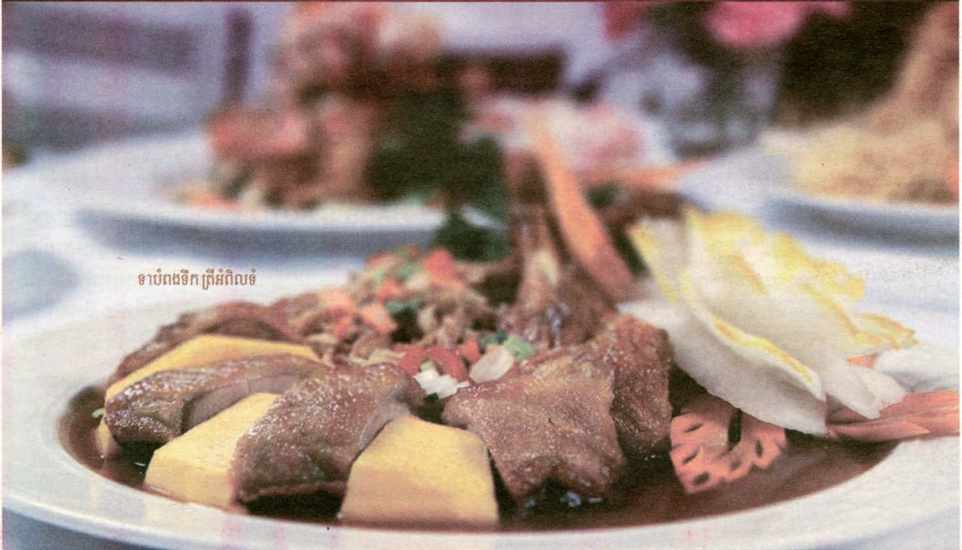
ទាបំពងទឹក ព្រីអំពិលទំ

Totally Traditional! Totally Cambodieliicious!