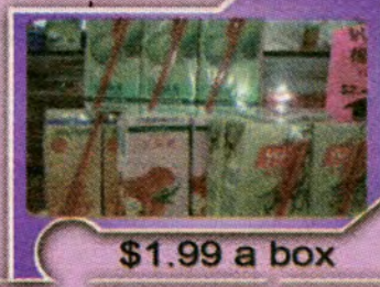
$1.99 a box