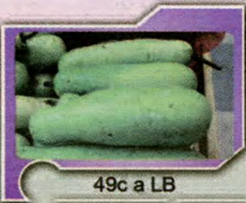
49c a LB