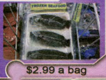
$2.99 a bag