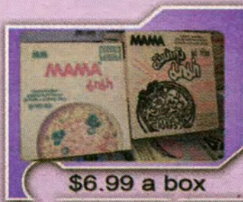
$6.99 a box