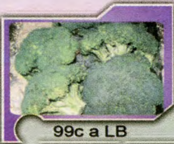
99c a LB