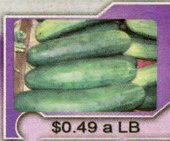
$0.49 a LB