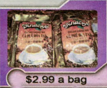
$2.99 a bag