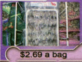
$2.69 a bag