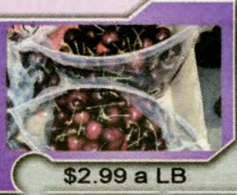
$2.99 a LB