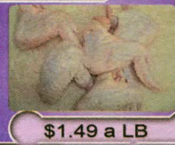
$1.49 a LB