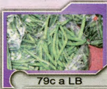
79c a LB