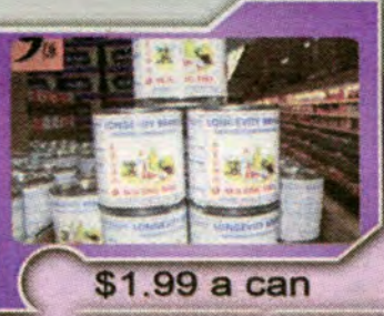
$1.99 a can