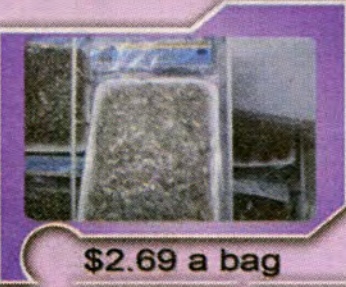
$2.69 a bag