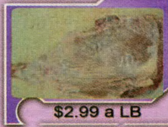
$2.99 a LB