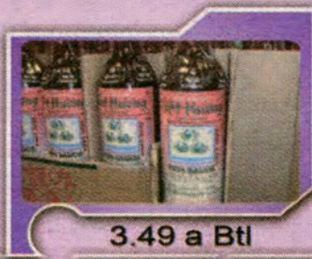
3.49 a Btl