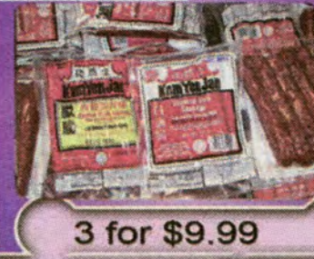
3 for $9.99