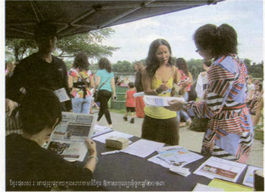
ខ្មែរផុសស.វ អាផ្សព្វផ្សាយក្នុងសហគមន៍ខ្មែរ ឱកាសបុណ្យអុំទូកឆ្នាំ២០១៣