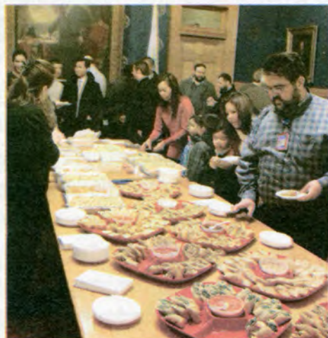
A crowd of over 300 enjoys the food from Eggroll Cafe and Viet Thai