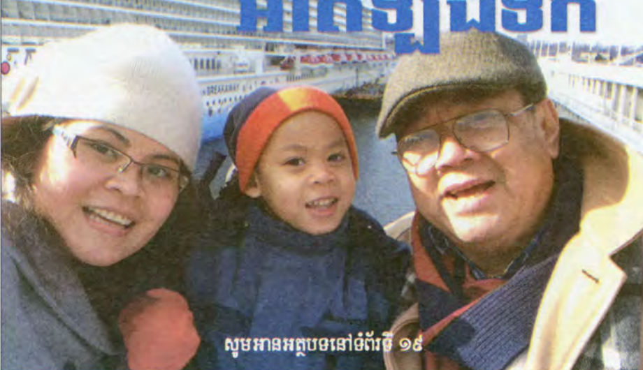
សូមអានអត្ថបទនៅទំព័រទី ១៩