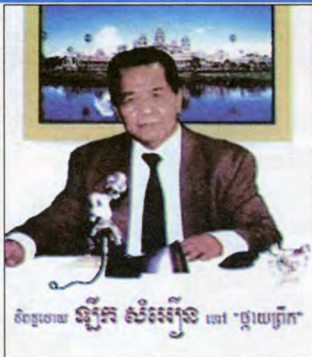
ឧត្តមសេនីយ៍ ឡឺត ឃឹម ទីត ជាតំណាងព្រះបាទនរោត្តម សីហនុ