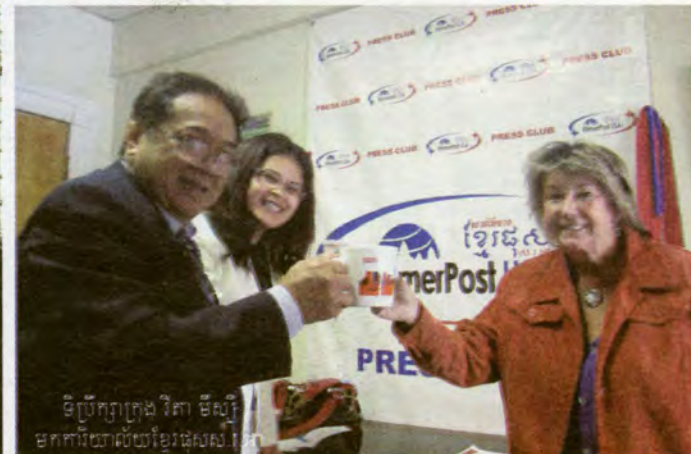
ទិប្រឹក្សាក្រុង វិទា មីស៊ី មកការិយាល័យខ្មែរផុសស.វ

ទំព័រមក៣២ទំព័រ និងអត្ថបទជាភាសាខ្មែរ-អង់គ្លេសបាន៤០% ។