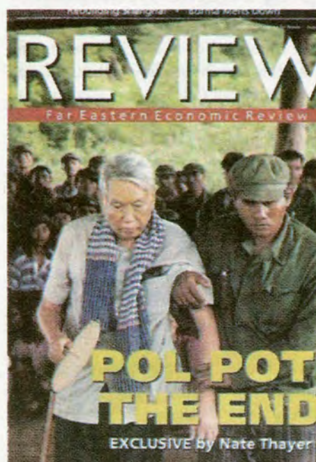
Original Article by Far East Economic Review

ថាយអីធ្វើការបកស្រាយនូវរឿងរ៉ាវរបស់លោក ទោះបីជាសំណងផ្នែកហិរញ្ញវត្ថុក្លាយទៅជាអសារបងក៏ដោយសំដៅទុកជាទី អាងដល់សេរីភាពក្នុងការបញ្ចេញមតិខាងផ្នែកសារព័ត៌មាន និងស្ថានភាពដែលកើតឡើងចំពោះអ្នកសារព័ត៌មានមិនជាប់កុងត្រាដូចជារូបលោកដែលជារឿងៗ តែងតែត្រូវបានកេងចំណេញពេលដែលធ្វើការជាមួយក្រុមហ៊ុនសារព័ត៌មានធំៗ ។