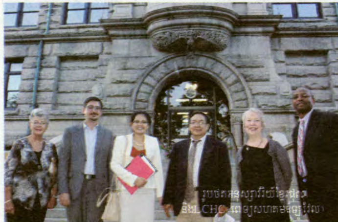
រូបថតអនុស្សាវរីយ៍ខ្មែរផុស និង LCHC ពេទ្យសហគមន៍ឡូវវែល

៤-តួនាទីជាជំនួយសហគមន៍ : យើងបានបង្កើតអត្ថបទខ្មែរ-អង់គ្លេសចំនួន៩ឆ្នាំមកហើយ ក្នុងបំណងឱ្យគ្រួសារខ្មែរដែលម្នាក់ចេះតែខ្មែរ ម្នាក់ទៀតចេះតែអង់គ្លេសឱ្យអាចយល់រឿងសង្គមរួមគ្នាបាន ហើយអាចពិគ្រោះគ្នាបានថែមទៀត ។ ឥឡូវនេះអត្ថបទខ្មែរ-អង់គ្លេស បានបង្កើតអត្ថន័យមួយទៀត គឺសហគមន៍អាមេរិកាំងដែលគេចង់យល់ពីខ្មែរដែលជាទូទៅទំនាក់ទំនងនោះមានលក្ខណៈចង្អៀតចង្អល់ ។ រីឯតួនាទីសង្គមដោយចំពោះនោះ យើងពុំមានអ្វីទេ ក្រៅពីផ្តល់ឧបករណ៍ ឬទស្សនៈប្រតិបត្តិដែលឆ្លុះបញ្ចាំងពីអំពើត្រូវនិងខុសបង្ហាញពីការគ្រោងសំរាប់អនាគតពន្យល់ពីអ្វីដែលត្រូវដឹងសម្រាប់ប្រើក្នុងជីវិតមិនព្យួរឱ្យឈ្លោះគ្នាបង្កើនចំណេះជួនអ្នកអាន...។ល។ ក្រៅពីបង្ហាញពីទស្សនៈត្រូវខុសនៅមានទស្សនៈ "ខ្មែរយោបល់គ្នា" តែជាទស្សនៈវិជ្ជមានដែលយោបល់ម្នាក់ៗសុទ្ធតែមានប្រយោជន៍សំរាប់អ្នកដទៃ បើមិនទាំងអស់ក៏មានអ្នកយល់ស្របខ្លះដែរ រីឯទស្សនៈដែលថ្មី ឬខុសគេស្រឡះក៏មិនច្បាស់ជាខុសនោះទេ... ដូច្នេះការទទួលស្គាល់នូវទស្សនៈអ្នកដទៃដោយមិនប្រកាន់ខឹងជាលក្ខណៈសម្បត្តិដ៏ប្រពៃដែលខ្មែរផុសតែងតែទទួលយកមកផ្សព្វផ្សាយជូនបានដោយគ្មានចង្អៀតចង្អល់ ។