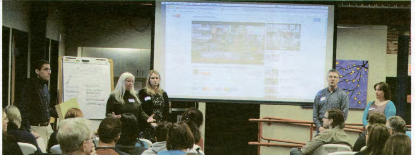
The second panel talked about video

អត្ថបទដោយ : ចេម អសមីស ប្រែសម្រួលដោយ : សុខា អង្គប្រជុំហ្វេស៊ីប៊ីស៊ីនដល់ទីបញ្ចប់ស្តង់ដេញ ពីរយៈពេលបីម៉ោងនៃអង្គប្រជុំដែលរស់រវើក លោក ឌីក ហ្វូវ (រីឆាដ ហ្វូវ) បានបង្កើតនូវ សំណួរសាកសួរអំពីស្ថានភាពនៃអង្គប្រជុំទាំងមូល ថាគួរដាក់ឈ្មោះអង្គប្រជុំនេះ ដោយដកពាក្យណា មួយចេញពីពាក្យដើមដែលមាន ហើយហៅអង្គ សន្និសីទនេះថា សន្និសីទសង្គមឡូវែល ។ ហេតុផល គឺគោលបំណងសំខាន់ដែលក្រោយអង្គសន្និសីទ គឺ ផ្តោតទៅលើមធ្យោបាយដែលមនុស្សទាំងអស់