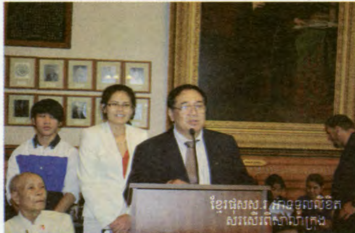
ខ្មែរផុសស.វ ភ្នាក់ងារលិខិតសរសេរពីសាលាក្រុង

នោះតែម្តង ។ ឆ្នាំនេះយើងបានធ្វើការចែកចាយកាសែតនៅឡូវវែល-លីន-វីវ៉ៃ-រ៉ូដ អាឡិន-កុណិមីកិត-ញូជីស៊ី-ហ្វីឡាដែលហ្វៀ ដែលរៀងរាល់ខែយើងបោះពុម្ពចំនួន១០ម៉ឺនទៅ១៥.០០០ម៉ឺនច្បាប់ ។