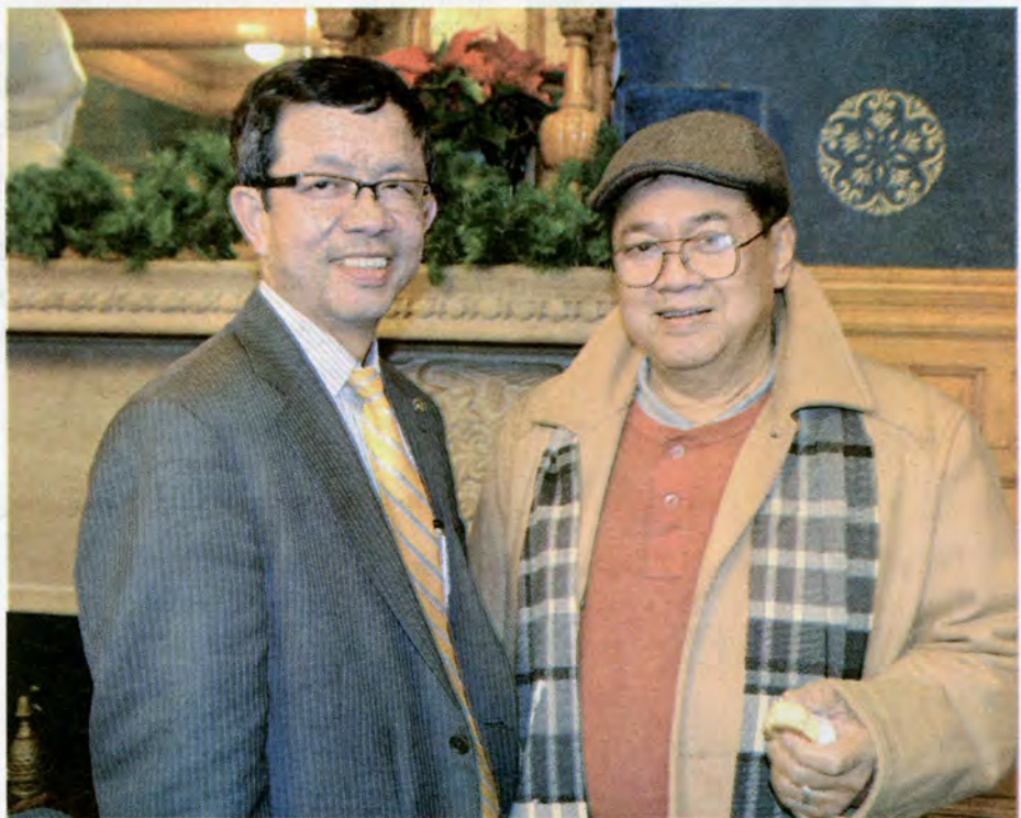
វាសនា នួន

នាយកសាលាក្រុង City manager តែត្រូវតែមានការនាំតាមរយៈក្រុមប្រឹក្សាក្រុងដែរ គឺត្រូវមានការគាំទ្រពីក្រុមប្រឹក្សាក្រុមភាគច្រើន... ក្នុងមកគេមិនសូវអើពើណែនាំឱ្យយើងដាក់ចូលទេ ជាពិសេសចូល "កុម្មុយនីស្ត" សំខាន់ៗ៤នោះ ដូចជានៅ Planning board, Conservation,