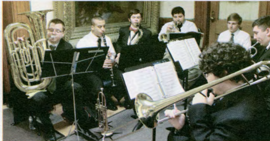
Lowell High School Students provided music