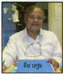
ដោយ : គឹម អៀន ប៊ុយណាវ៉ា

សូមឱ្យបងប្អូនខំ ចូលរួមឱ្យបានកាន់តែ ច្រើនកាន់តែល្អ... វត្ត ជាវត្តរបស់ខ្មែរយើង