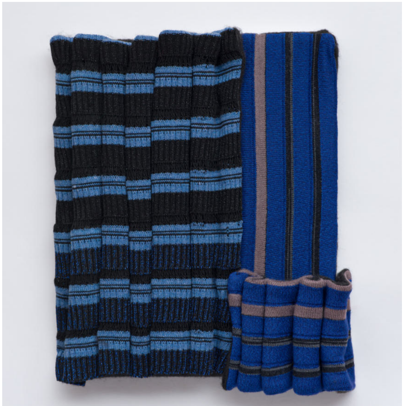
Descartes textiles industriales cosidos a mano (2021). 33 x 28 x 5cm

Lunes a Viernes, de 14:00 a 21:00 Sábados, de 14:00 a 22:00 Domingos, de 14:00 a 21:00 Sala Abraham Vigo [PB]. Entrada gratuita