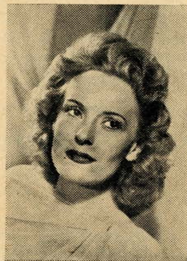
JARMILA NOVOTNÁ, členka Metropolitní Opery v New Yorku.