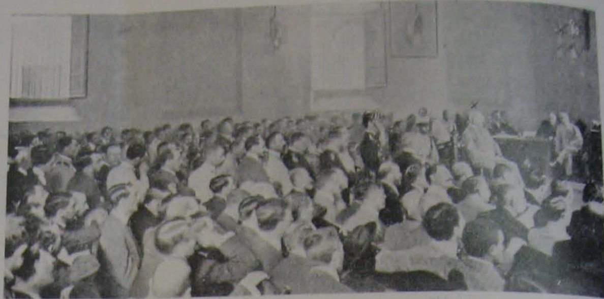
IL PROCESSO ( la x indica FERRER )

L'avvocato difensore un ufficiale scelto a caso da una lista da Ferrer si battè con passione convinto della piena innocenza del suo assistito, ma invano. Quattro giorni dopo la sua condanna a morte cogliendo il mondo di sor-