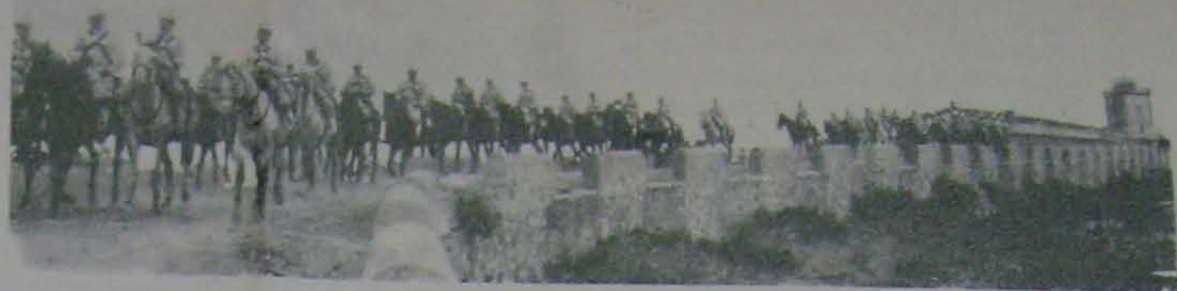
la cavalleria lancia MONTJUICH dopo l'esecuzione

Gli uomini divenuti ragionevoli, contrariamente a quel che sono oggi, troveranno bene il modo senza rompersi il capo, d'essere proprietari vita natural durante di quanto li circonda, ma questo diritto alla proprietà non nuocerà a nessuno e non creerà nessuna supremazia. La follia di coloro che non comprenderanno l'anarchia consiste precisamente nell'impossibilità di concepire una società ragionevole.